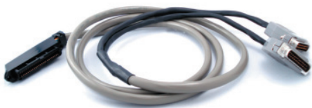
Câble amphénol en Y optionnel